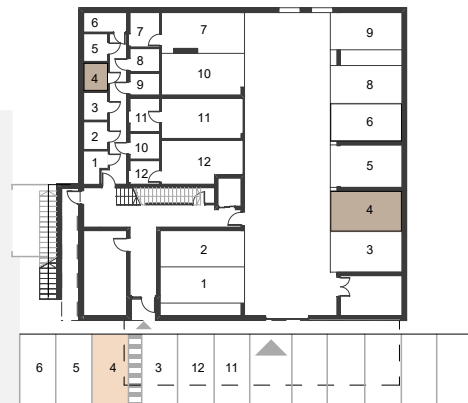
POLOŽAJ PARKIRNEGA MESTA IN SHRAMBE V KLETI