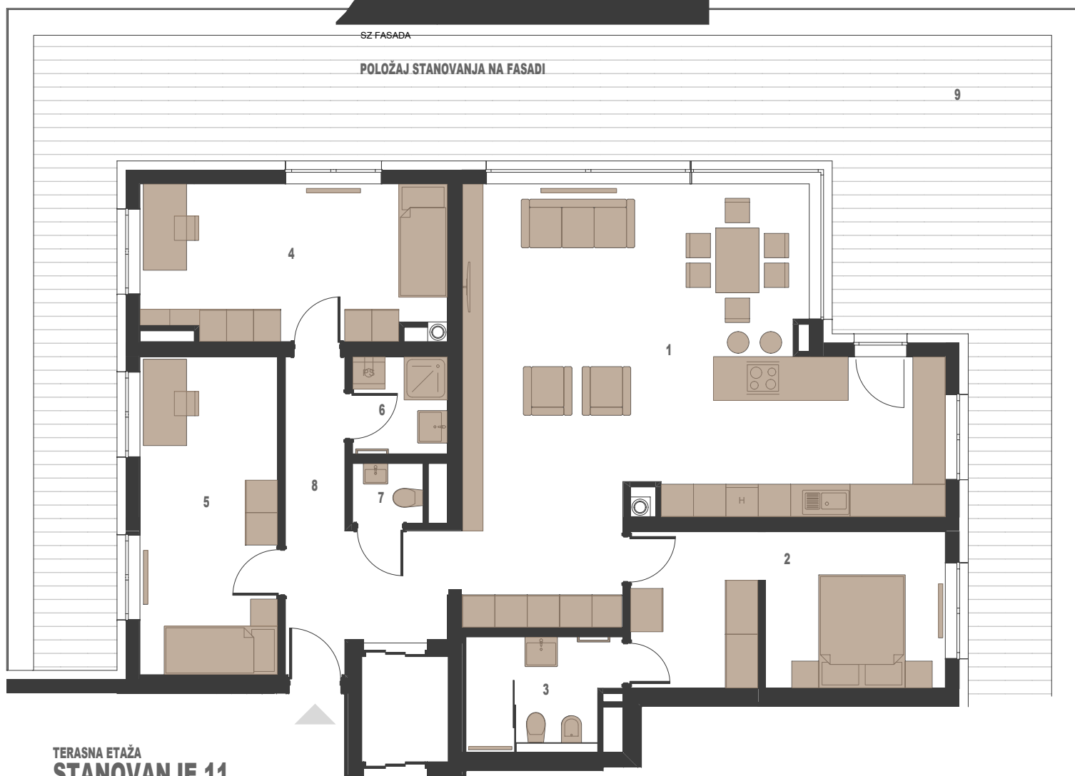
POLOŽAJ STANOVANJA NA FASADI