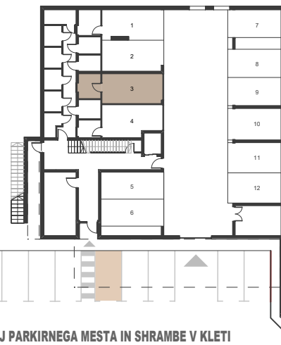
POLOŽAJ PARKIRNEGA MESTA IN SHRAMBE V KLETI