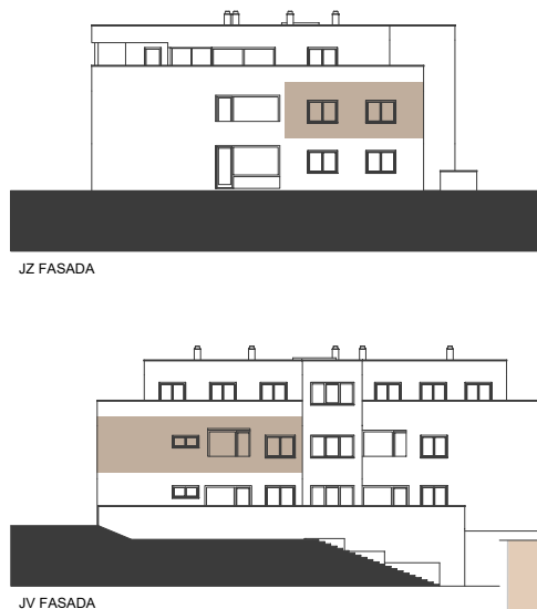
POLOŽAJ STANOVANJA NA FASADI