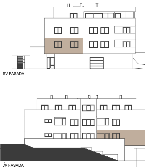
POLOŽAJ STANOVANJA NA FASADI