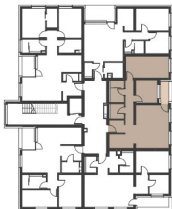
POLOŽAJ STANOVANJA V ETAŽI